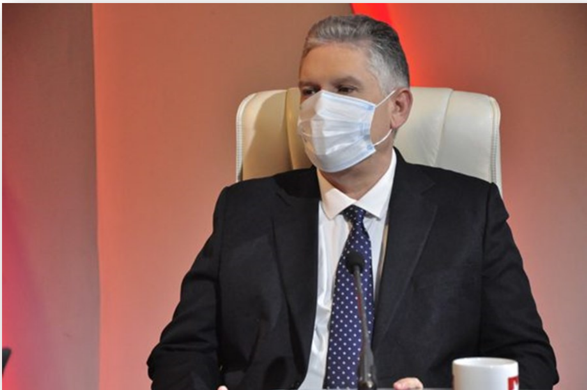
El Vice Primer Ministro y Ministro de Economía y Planificación Alejandro Gil Fernández compareció en la Mesa Redonda.